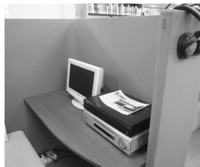
⑥マルチメディアコーナー