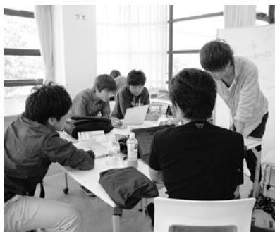
①グループ学習スペース