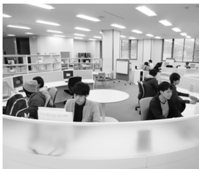
⑤PCグループ学習スペース