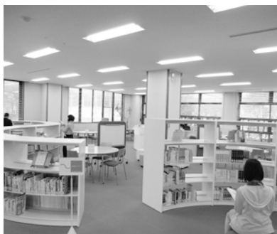
④ブラウジングスペース