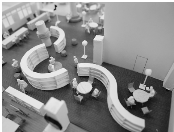
書架イメージ (模型製作:都市工学専攻田口研究室)

リニューアルオープン後、初めて図書館を訪れた利用者からは、「明るくなった」、「おしゃれ